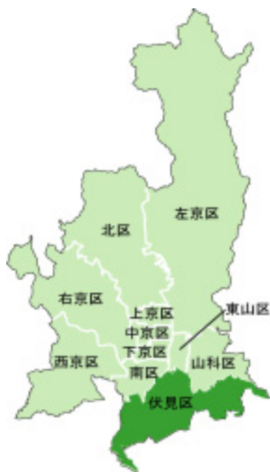
図一2 伏見区の位置