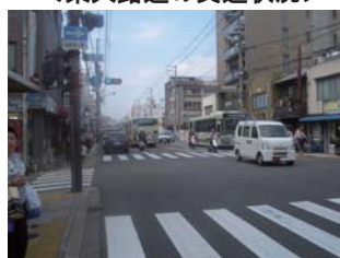
＜東大路通の交通状況＞

車道、歩道の幅員が狭く、歩行者にとって、安全で快適な通行環境が整っていません。また、自転車についても、原則として車道を走行する必要がありますが、車道が狭く、歩道を通行することもあり、自転車の安全な通行環境も整っていません。