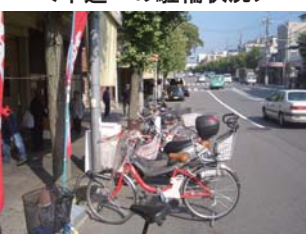
＜車道への駐輪状況＞

歩道幅員が十分に確保されているにも関わらず、歩道上への商品のはみ出し陳列や、車道部への自転車の駐輪などにより、安全、快適な通行に影響を与えています。