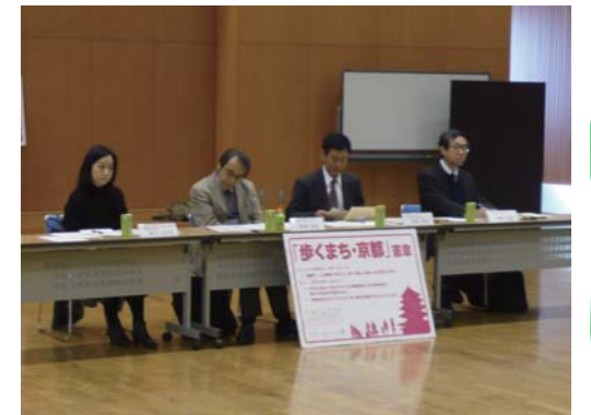
左から、井上准教授（京都女子大学） 岡田教授（京都大学） 宗田准教授（京都府立大学） 若林教授（名城大学）