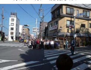
＜東山五条の混雑状況＞

沿道に官公庁や病院など生活に密着した施設や、名所、旧跡、文化施設などの観光施設が多数所在することから、自動車や歩行者などの通行が多くなっています。さらに、平成23年4月には、小中一貫校（開晴館）が開校し、多くの児童や生徒が東大路通を通学路として利用することとなります。