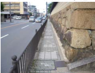
＜馬町交差点付近の歩道＞

歩道と車道との段差が大きい箇所や、横断勾配の急な箇所があります。また、東山三条～東山七条は、歩道幅員も狭く、高齢者や身体に障害のある方などが安心、安全に通行することが難しい環境になっています。