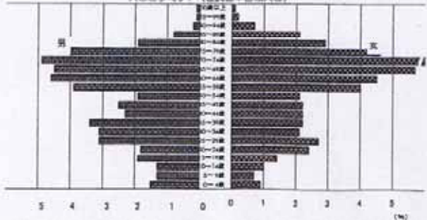
人口ピラミッド(住民基本台帳人口)