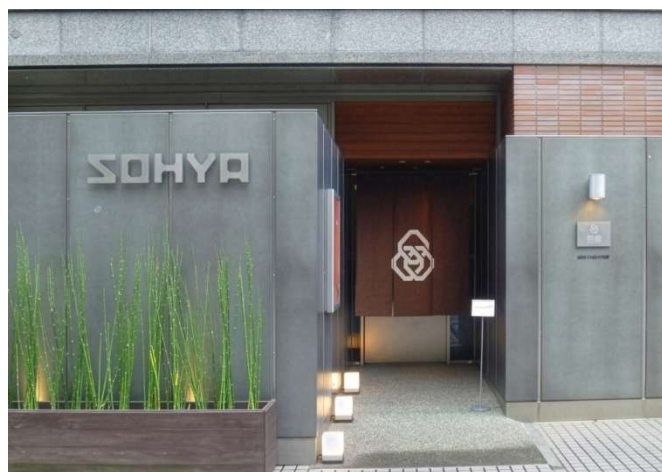
植栽や足元の灯りが広告物と共に店先に彩りを添える。