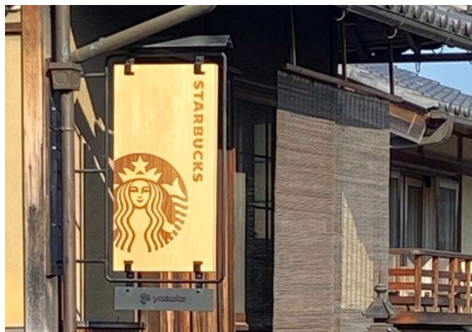
町並みに合ったデザインと素材で企業や商品に好印象を与える。