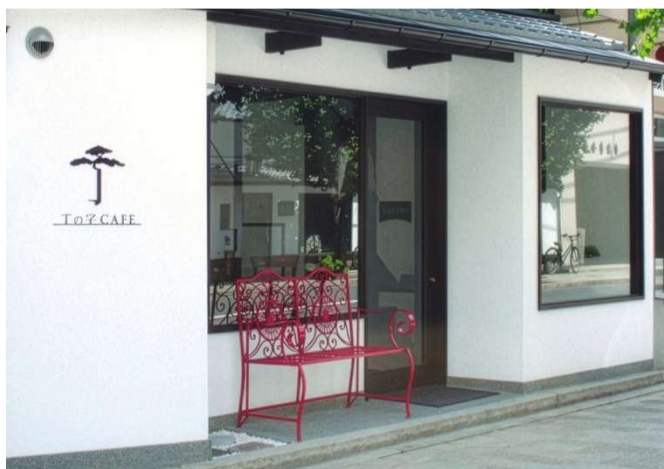
シンプルながら歩いていると足を止めたくなる店先を演出する。