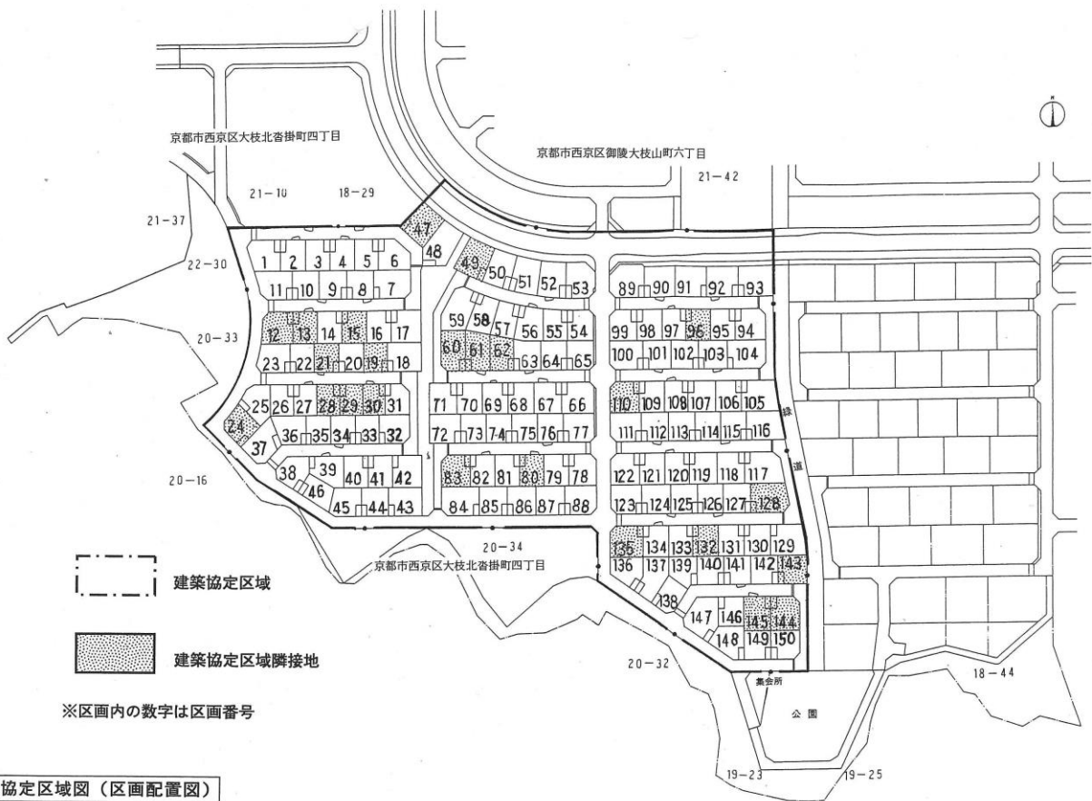
建築協定区域図（区画配置図）