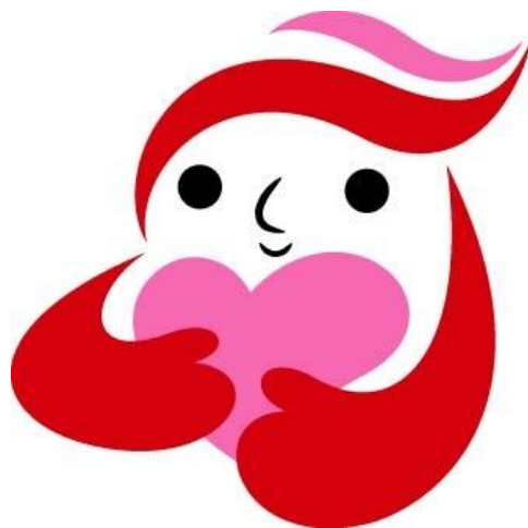
犯罪被害者等支援シンボルマーク 「ギュっとちゃん」