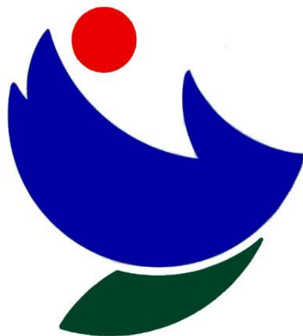
京都犯罪被害者支援センター