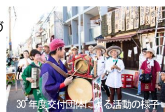
30年度交付団体による活動の様子