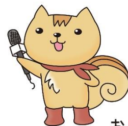
おあがリス 京都市食の安全安心 啓発キャラクター

市民及び観光客の安全安心の確保と、地域住民の生活環境の保全のため、これまで取り組んできた「民泊」に対する通報等への対応や、違法・不適切な「民泊」に対する指導等について、引き続き取組を進める。