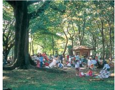
京 都 御 苑