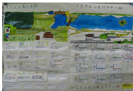
最優秀作品 (団体の部)