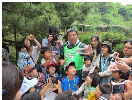
平成28年度 第1回「平安神宮」