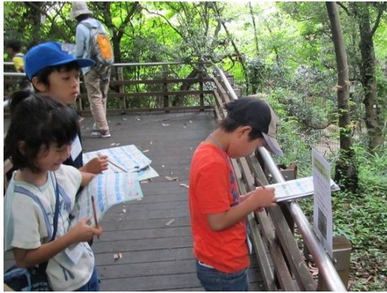
クイズに答える参加者

平成28年度の新規事業として、親子を対象にしたイベント「生きものみっけラリー」を開催した。本件は、京都水族館との連携事業であり、京都水族館及び梅小路公園いのちの森を会場に、参加者自らが生きものを探し、発見してクイズに答えながらラリーを実施する体験型イベントである。2日間で3回開催し、計91名が参加した。