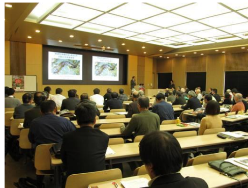
平成28年1月15日開催(キャンパスプラザ京都, 113名参加)