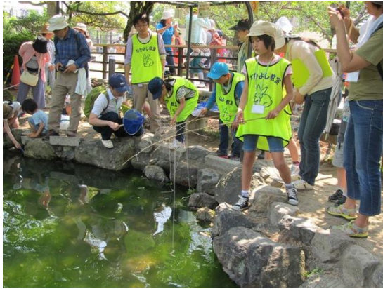
ザリガニ釣りの様子

平成28年度の新規事業として、親子を対象にしたイベント「フィールドビンゴ in 京都市動物園」を、国際生物多様性の日（5月22日）に合わせて開催した。本件は、京都市動物園との連携事業であり、京都市動物園の京都の森等において、ビンゴシートに記載された内容に当てはまる生きものを探しだし、ビンゴを完成させる自然体験型イベントである。当日は30名が参加した。