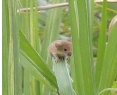
カヤネズミの保護活動(桂川)