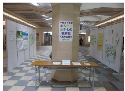
入賞作品展示の様子