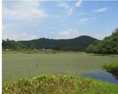
深 泥 池

生物多様性に触れる機会が増え、さらには保全活動への参加につながるよう、市内の身近な自然に関する情報を、①生きものやその生息・生育場所、②生息環境保全の取組、③観光や伝統文化を支える生物多様性の情報の3つの区分に分けて「京都生きもの100選」として取りまとめ、生物多様性専用ホームページ「京・生きものミュージアム」等で紹介している。