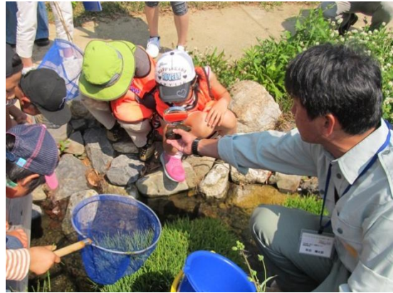
虫めがねで観察している様子