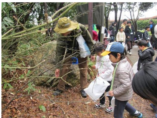
平成27年度 第6回「梅小路公園いのちの森」