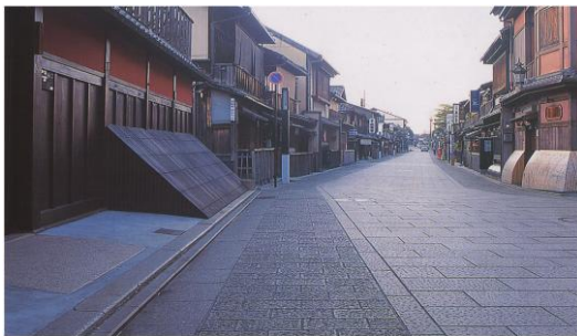
祇園町南歴史的景観保全 修景地区