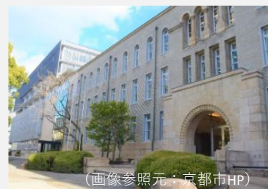
(画像参照元：京都市HP)

社寺や京町家等の伝統的な木造建築物の指定が進む一方で、その他の時代を代表する建造物の指定件数は少ない。あらゆる時代の積層として歴史的町並みを捉え、景観重要建造物の指定運用を検討すべきではないか。