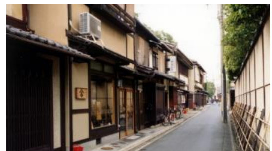
上京小川歴史的景観保全修 景地区