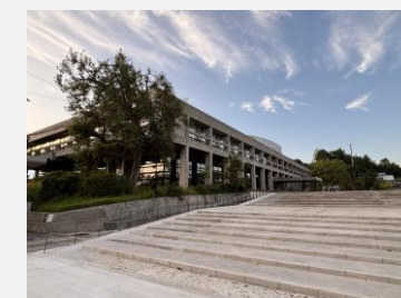
旧上野市庁舎（伊賀市）