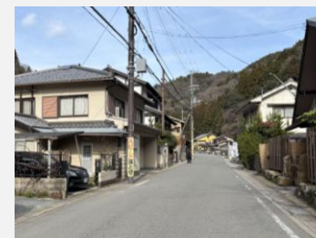
鞍馬街道域（風致地区）