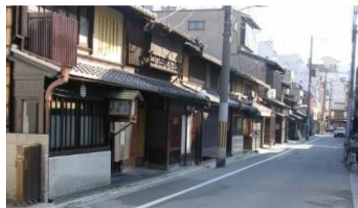
祇園縄手・新門前歴史的景観 保全修景地区