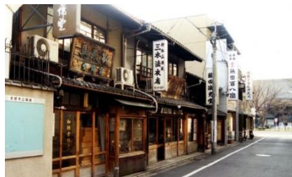
本願寺・東寺地区