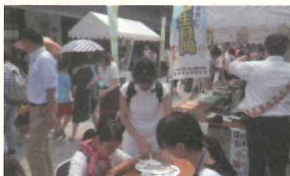
食の安全・安心デー (8月1日)