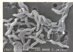
※カンピロバクター電子顕微鏡写真

施設への監視指導の際には、収去(抜取り)検査や施設での簡易検査など、科学的根拠に基づいた監視指導を実施します。