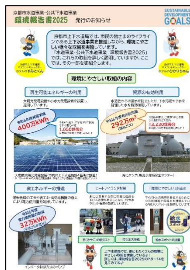
発行のお知らせチラシ