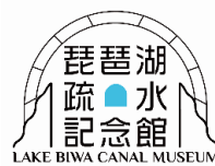
琵琶湖疏水記念館ロゴマーク