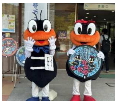
昨年度のグリーティングの様子