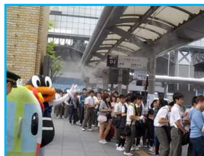
（京都駅前バスのりばでのPRの様子）