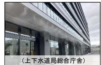
(上下水道局総合庁舎)