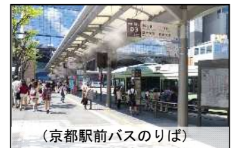
(京都駅前バスのりば)