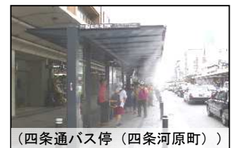
(四条通バス停（四条河原町）)