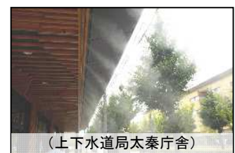
(上下水道局太秦庁舎)