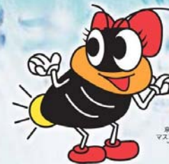
京都市上下水道局 マスコットキャラクター 「ひかりちゃん」