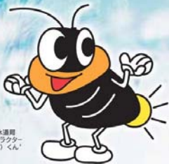
京都市上下水道局 マスコットキャラクター 「源助（すもと）くん」