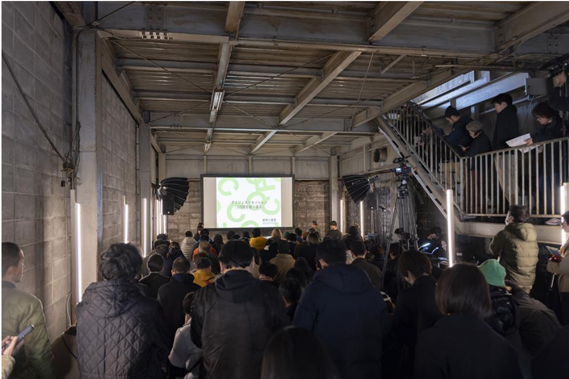
「都市と循環 2024」の様子。約 500 名に及び、多様な分野の専門家・実践者が集まった。

2023、2024、2025 と毎年 1 回、京都に全国からそうした事業者たちが集結して関係づくりをしてきたこのイベントは、年を追うごとに規模が徐々に拡大し、2025 年からは京都市との共催イベントへと発展しました。そして民間の事業者にとっての啓蒙かつネットワークづくりのために自発的に始まったこの取り組みは今や、未活用公共施設を舞台に循環型都市を実証する、官民一体となった一大イベントへと発展しつつあります。