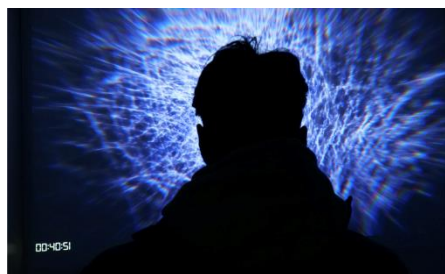
Somnorama : Echoes from sleep and dreams