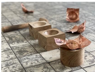
©Fabiola Burgos Labra 偶然性の美学-Life is what happens to you while you are busy making other plans