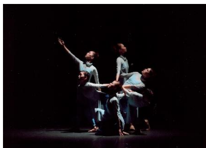
京都バレエ団 「伝承の芸術 そして未来へ」