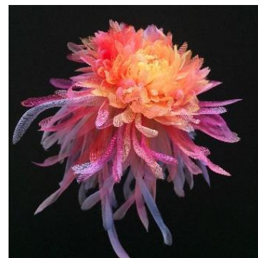
© Séverina Lartigue 無限の開花 Maîtres d'art-Elèves français × VAGUE by Teruhiro Yanagihara Studio