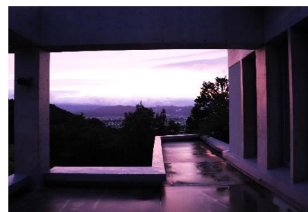
ニュイ・ブランシュ KYOTO × ヴィラ九条山