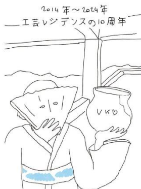
©Pauline Brun (lauréate Villa Kujoyama 2023, danse) ヴィラ九条山での 工芸レジデンス 10 周年