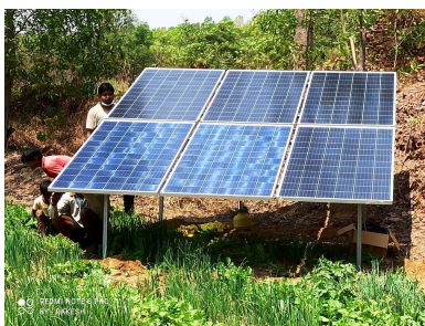
ため池の水を太陽光発電で揚水。