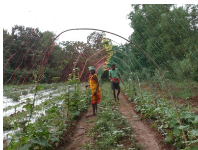
太陽エネルギーを利用した灌漑農業により、野菜や穀物の栽培が可能に。