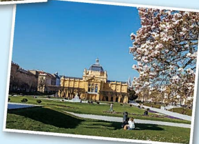
トミスラフ王広場 (Trg kralja Tomislava)