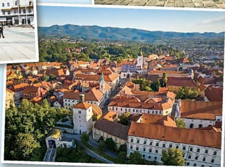
上の街 (Gornji grad)