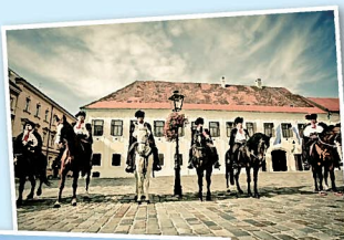
クラヴァット連隊の名誉警備兵 (Počasna straža Kravat pukovnije)