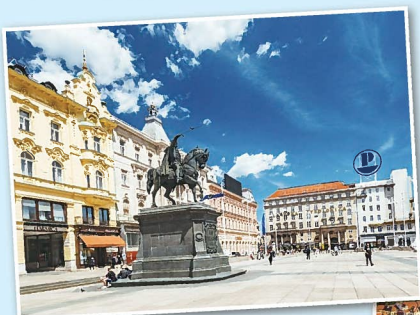
ヨシップ・イェラチッチ総督広場 (Trg bana Josipa Jelačić)