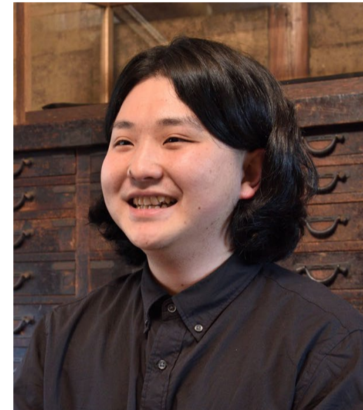
移りゆくまちプロジェクト