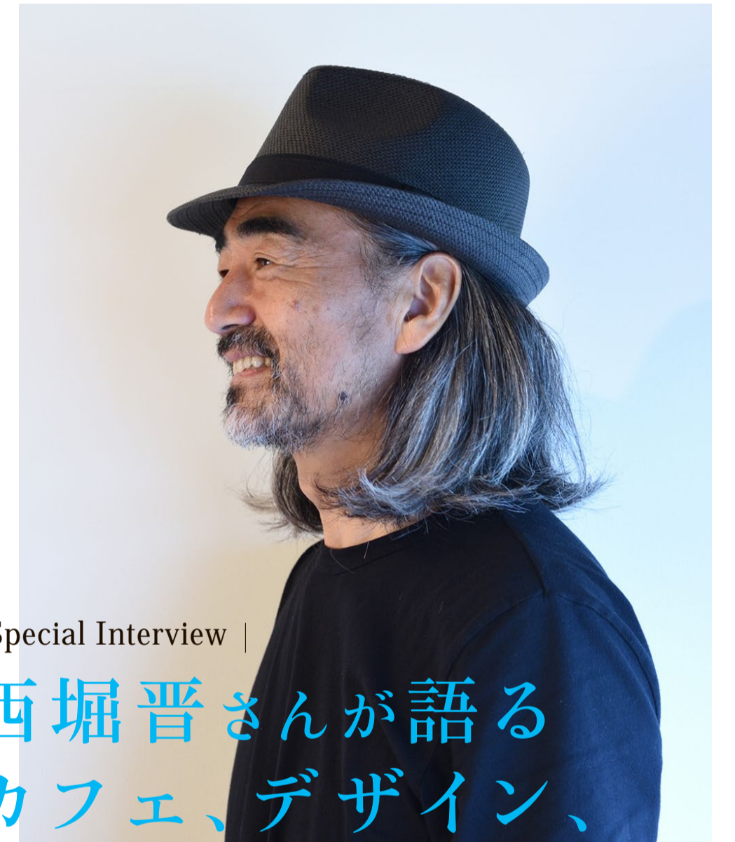
| Special Interview |