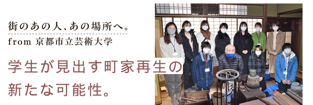
街のあの人、あの場所へ。 from 京都市立芸術大学