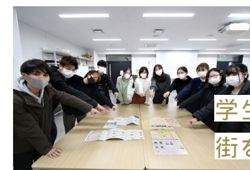
街のあの人、あの場所へ。 from 京都美術工芸大学