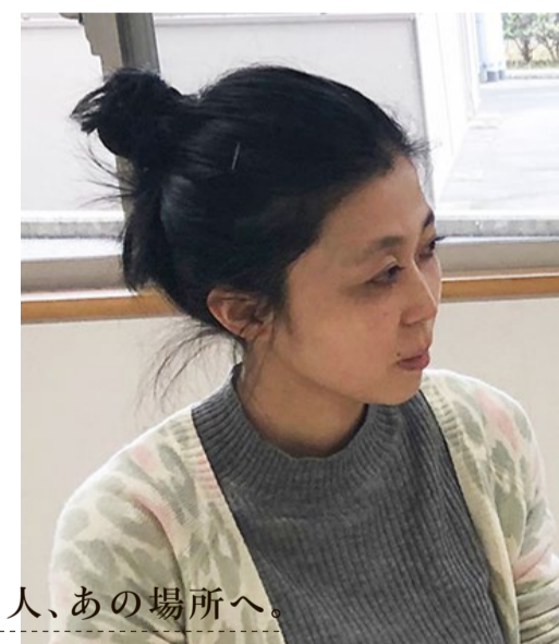
街のあの人、あの場所へ