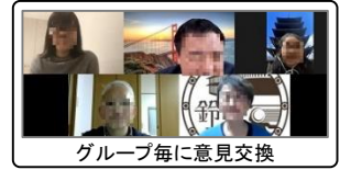
グループ毎に意見交換

4つのグループに分かれて、ワールドカフェ形式により、この場に期待していること・話したいことをテーマに、途中でメンバーを替えながら意見交換を行いました。