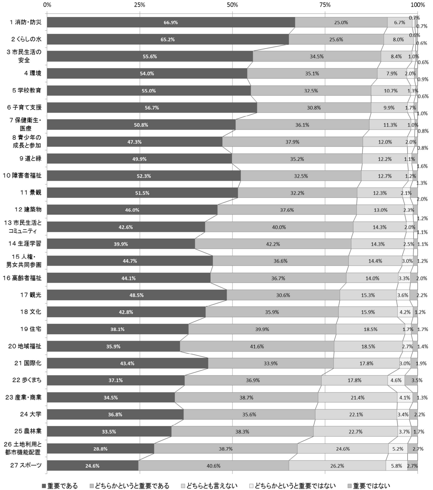
【別表2】政策の重要度

※ 上記グラフ内は、有効回答に占める「重要である」～「重要ではない」を選択した人の割合を記載している。 ※ 政策重要度は、「重要である」または「どちらかという重要である」を選択した人数を有効回答数で除する方法により、順位付けを行っている。 なお、上記グラフではそれぞれの割合の内訳を示しているため、四捨五入の関係で、「重要である」と「どちらかという重要である」の割合の合計が同率となる場合がある。