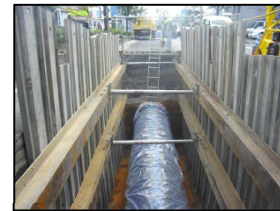
【水道耐震管の布設の様子】