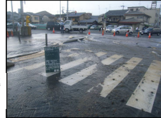
【水道管が破損し吹き出した様子】