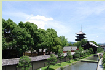
宗教や芸術文化の集積