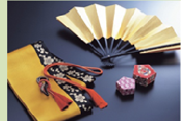
高品質な伝統工芸

日本文化の神髄ともいべき京都で国際会議を開催することで日本文化を世界に発信する。