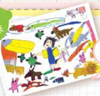
保育園、幼稚園組 市長獎 植村 幸汰