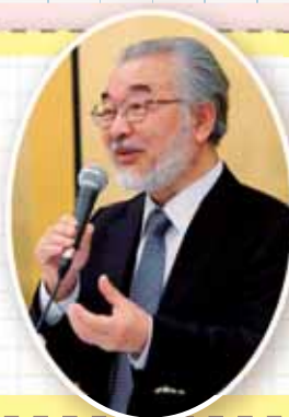
京都市基本规划审议会会长 尾池和夫先生 (财团法人国际高等研究所所长、 前京都大学总长)

如果市民们在今后的10年里能以参与和合作为共同的口号，合力推进这个规划的话，我想我们的未来一定更加美好！