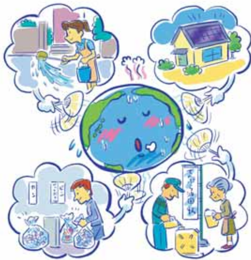
※低碳 温室气体的排放少。

通过尊重并共享京都人在漫长历史中培养的价值观——“珍惜”、“有始有终”、“关照”的精神，在交通、城市建设、制造、工作、居住及生活等所有场合，全体市民一起实践环境共生和低碳型城市建设，在国内外的地球温室化对策中发挥引领作用。