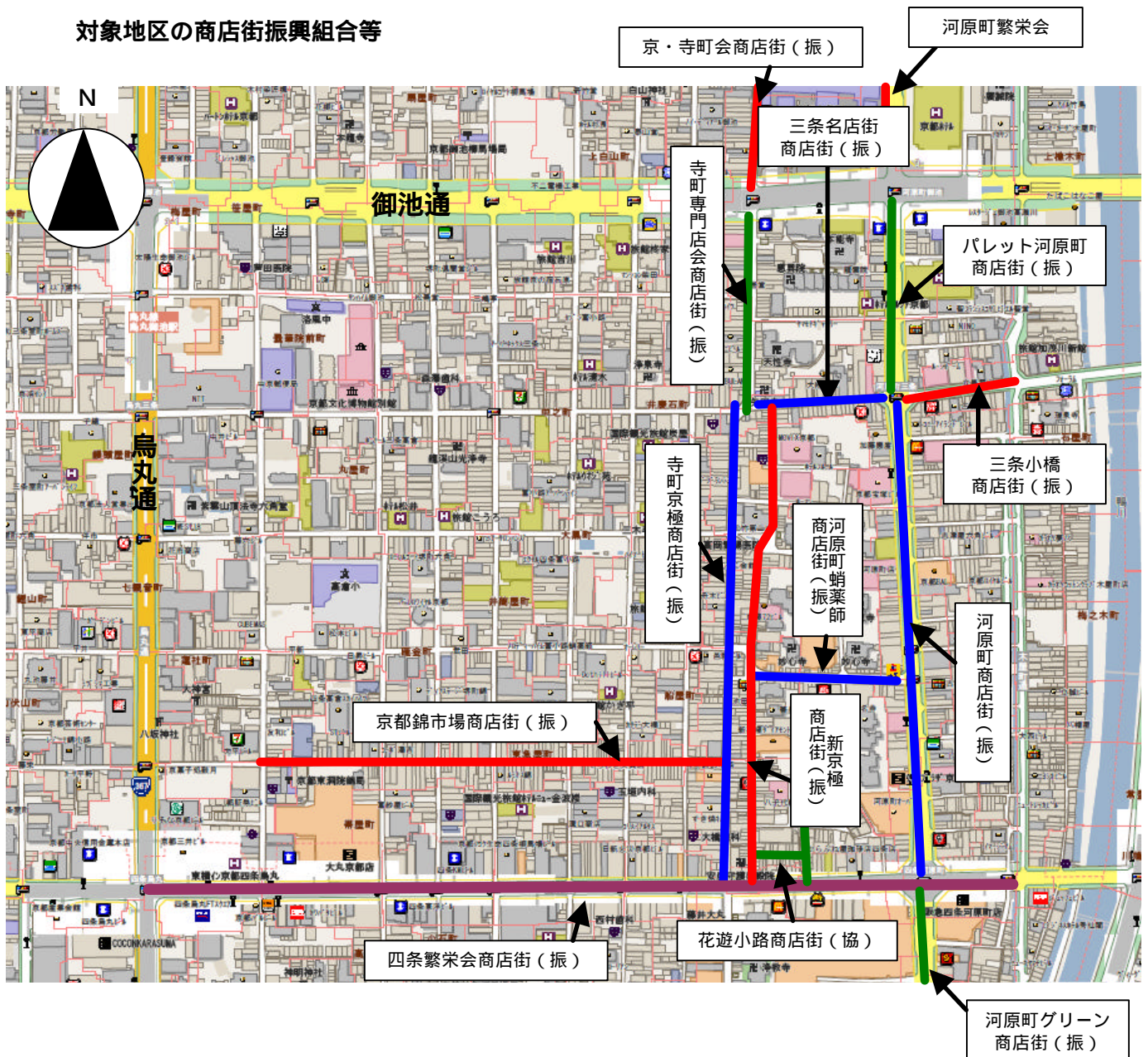
対象地区の商店街振興組合等

また、多数の店舗が集積しており、大規模店舗も、「大丸京都店」、「藤井大丸」、「高島屋京都店」、「四条河原町阪急」、「河原町OPA」、「京都ロフト」、「ファッションビルBAL」など多数が立地しています。