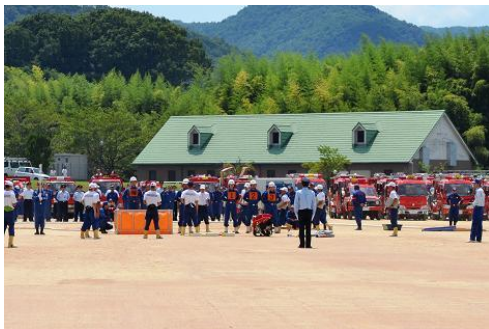
実放水訓練（小型ポンプ操法）