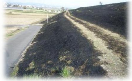
たき火による火災の焼け跡

たき火等、火災と紛らわしい煙を発生する行為をする場合は、京都市火災予防条例により、事前に消防署への届出が必要になります。