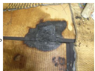
畳の無炎燃焼の形跡