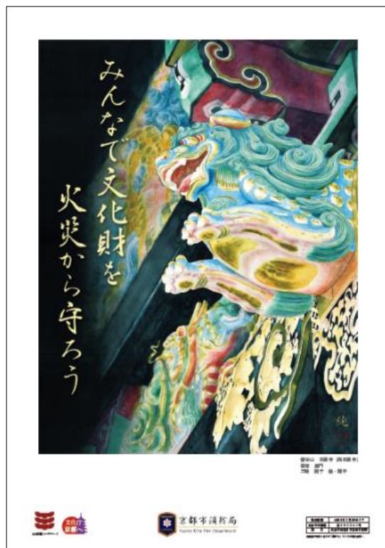
令和 6 年文化財防火啓発ポスター