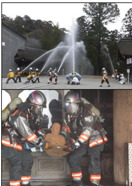
過去の合同消防訓練の様子