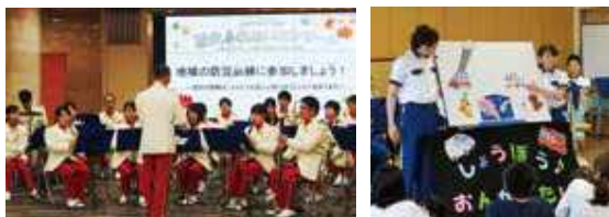
消防音楽隊による防火指導 Fire band talking about fire prevention