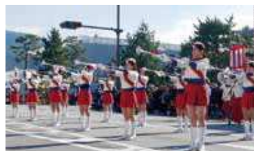
消防カラーガード隊の演技 Performance by the color guard team