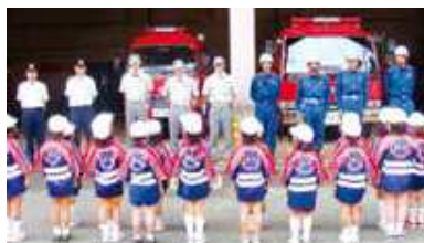
幼少年への防火指導 Promotion of fire prevention for kids