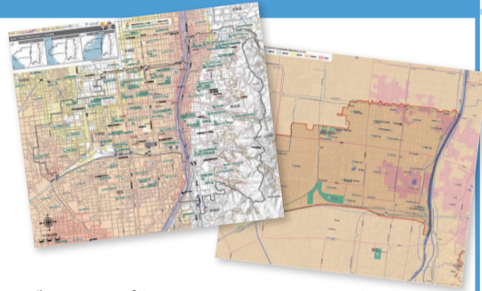
ハザードマップ(左:水害編、右:地震編)