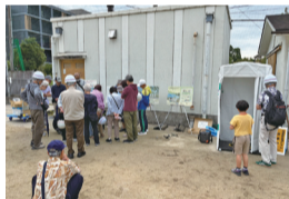
▲地域の防災訓練などの様子▶