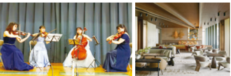
過去の演奏の様子

思い出の学校(元植柳小学校・元安寧小学校)の 校歌等の演奏をお楽しみください。 ※演奏曲は予告なく変更されることがあります。 【演奏者】京都市立芸術大学フルート四重奏 〈来場に当たっての注意〉 係の案内に従って御入場ください。他のお客様も御利 用になるロビーでの待機は御遠慮ください。また、席に は限りがあり、立ち見となることがあります。