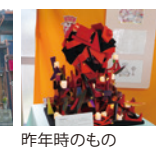
七条えんま堂 昨年時のもの