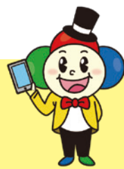
下京区キャラクター シモンちゃん