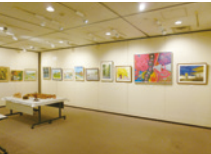
以前の展示の様子