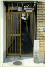
▲堺町にある鉄輪石碑