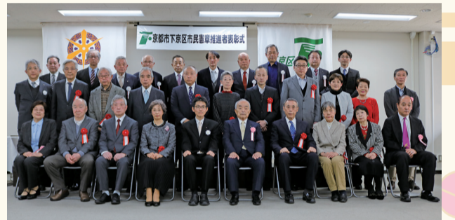
令和5年度の推進テーマ 市民の力、文化の力で地域を元気に