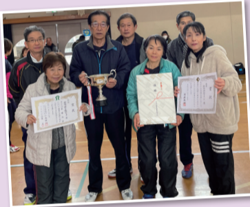
▲優勝の光徳Aチームの皆さん