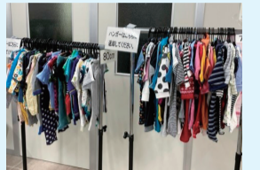
▲リユース会当日の様子