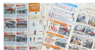
※写真はイメージです

京都市中央卸売市場近くの商店街「七条中央サービス会」では、龍谷大学と連携して商店街MAPパンフレットを発行します。年間を通じて商店街店舗でお得に利用できるクーポンや商店の催事スケジュール、便利なマップなどを掲載。3月20日(月)から各店舗で配布します。この機会にぜひ商店街を訪れてみてください！