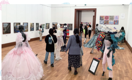
毎年10月に京都市京セラ美術館で開催している「美工作品展」