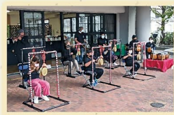
▲11月5日崇仁文化祭の様子

「いつ何が起こるか分からない」、「何が起こってからは遅い」、そんな意識のもと、学区の皆さんに何事もない毎日を送ってほしく活動しています。他学区で実践されている良い事例を学んだことで、今年度は、避難所が二つある七三学区での災害時に備え、正しい場所に素早く避難できるように、町内別の避難プレートと各家庭に防災マグネットシートを作成し、学区防災訓練で全町内に配布しました。これらを目にするたびに、防災意識が少しずつ学区の皆さんに芽生え、災害時に助け合いのつながりができる七三学区になればと思います。