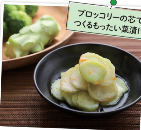
ブロッコリーの芯でつくるもったい菜漬け