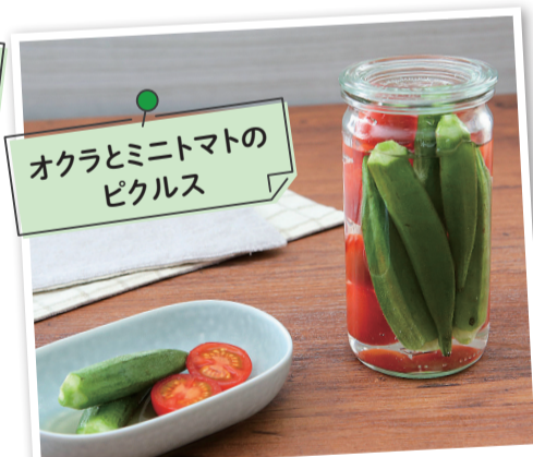
オクラとミニトマトのピクルス