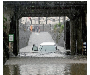
▲アンダーパス浸水(他都市例)