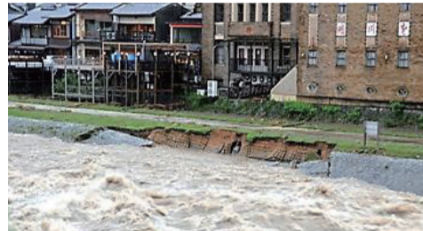
▲平成30年7月豪雨 鴨川三条大橋付近

大雨により河川が氾濫し浸水被害が起こる可能性がある下京区。鴨川沿いの地域では、浸水により建物が倒壊する恐れもあり、立退き避難が必要な区域に指定されている場所もあります。 その他にも、地下施設やアンダーパス(鉄道や道路の下を通る地下道、区内には5か所)への浸水リスクがあります。