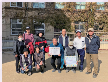
優勝チームの皆さん

11月7日(日)、下京中学校成徳学舎のグラウンドで2年ぶりに開催されました。晴天の下、38チームが参加され、熱戦が繰り広げられました。上位の結果は左記のとおりです。