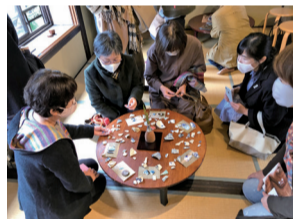
← 過去の陶磁片ワークショップの様子