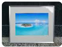
トラベルフォトグラファー 末永あかね 「世界写真旅行」