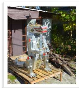
田中一樹 《PAPA SYOKI(父ちゃん鍾道)》