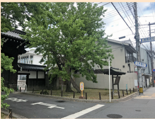
京都七條(旧西八百屋町)巡査派出所跡

はがきに、クイズの答え・郵便番号・住所・氏名・年齢のほか紙面への感想を書いて、7月10日(金)必着で、地域力推進室「謎とき」下京係までお送りください。正解は8月15日号に掲載し、正解者の中から抽選で2名の方に景品を差し上げます。当選の発表は、景品の発送をもって代えさせていただきます。