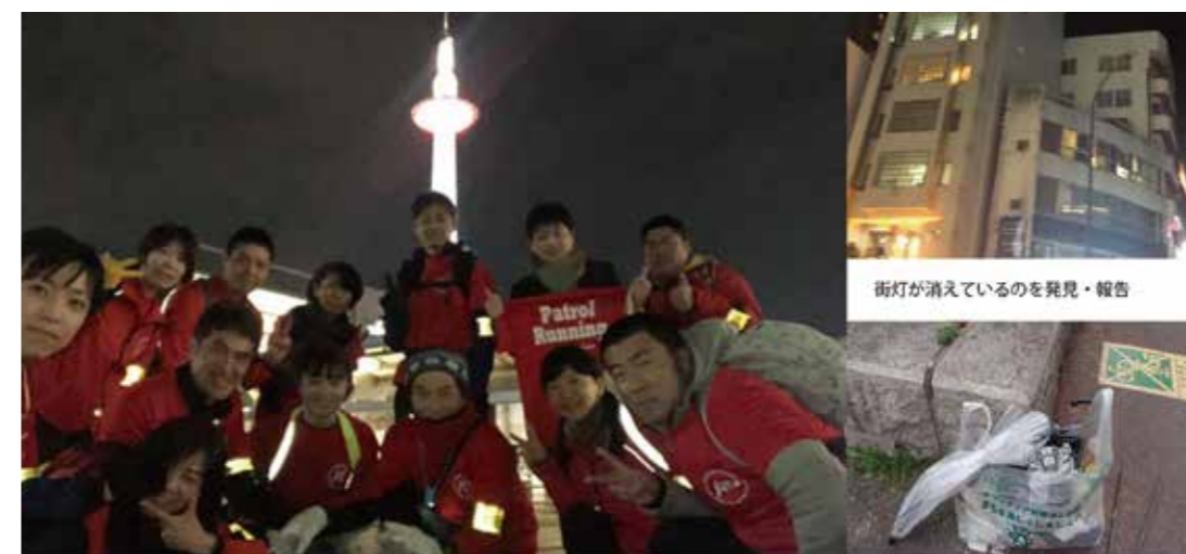
毎月8日に合同パトロールを実施

現在、京都駅を中心に行っている下京区内でのパトランについて、拠点を増やすことで幅広いエリアをカバーできるようにします。また、ポイ捨てなどのゴミが多いエリアでもあるため、パトロール活動に加えて清掃活動を行うことで、犯罪が起こりにくい街づくりをしていきます。また減災カフェも活動に関心がある方を繋ぐとともに、減災防災に関心が薄い方に対しても参加できる場を各地で実施します。