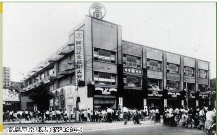
高島屋京都店(昭和26年)