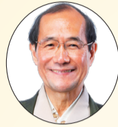
京都市長 門川 大作

50年後、100年後も「住みたい」「働きたい」「訪れたい」と思っただけの魅力溢れる下京区を一緒に実現していきましょう！