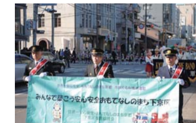
年末防火パレード(平成29年度)