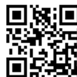
ウェブサイトのQRコード