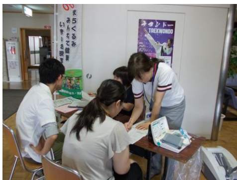
骨密度・血管年齢の出張測定

下京歩歩（ぽっぽ）塾への支援、健康づくりサポーター（しもけんズ）養成講座・活動支援等