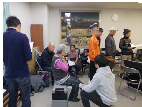
下京歩歩塾での筋力測定