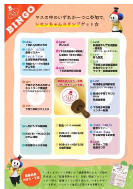
←29年度実施した際の ビンゴカード