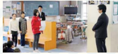
斬新な提案が祇園祭だけでなく、下京の未来を切り拓く!

洛央小学校の5年生は、総合的な学習のまとめとして「これからの祇園祭の課題」について考え、3月21日、下京区長に67の提案をしました。 児童からは、子どもや学生の関心をもっと集め、担い手や資金不足の問題を解決しようというものや、観光客にもっと歴史を知ってもらうといった多岐にわたる提案があり、区長は「未来志向の提案に感銘を受けた。同じ