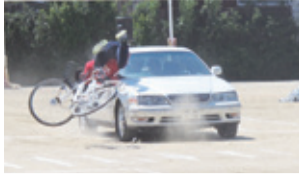
児童、保護者、地域の皆さんが参加し、迫真のスタントに真剣な眼差しを向け

5月13日に七条中学校のグラウンドにおいて、プロのスタントマンが交通事故の瞬間を再現し、事故の衝撃や怖さの実感を通じて、交通ルールを守ることの大切さを学んでもらう「スケアドストリート方式」という手法の自転車交通安全教室が開催されました。